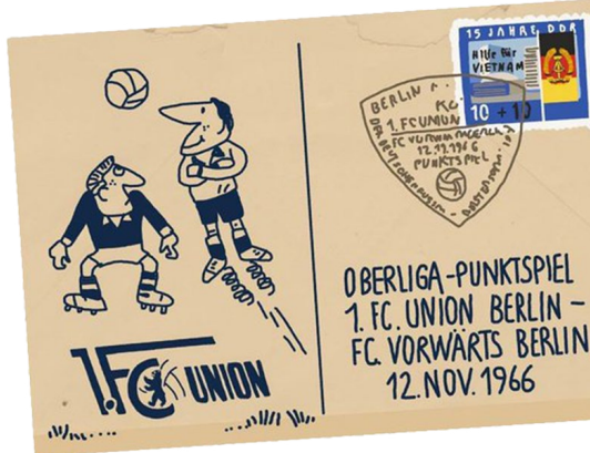
1. FC Union Postkarte von 1966