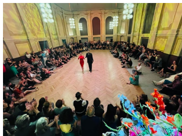
Showtanz auf dem Parkett des Großen Saals